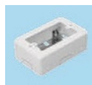
1 個用スイッチ BOX